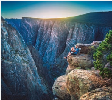
BLACK CANYON OF THE GUNNISON NATIONAL PARK