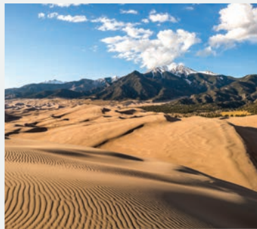
GREAT SAND DUNES NATIONAL PARK & PRESERVE