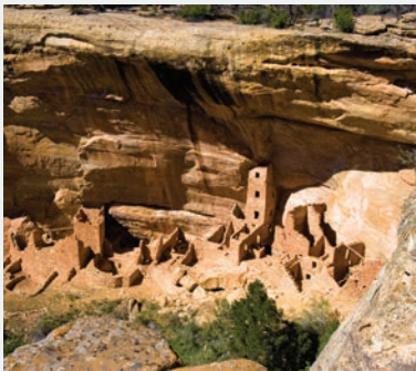
MESA VERDE NATIONAL PARK