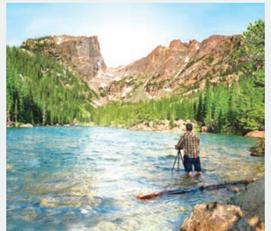
ROCKY MOUNTAIN NATIONAL PARK